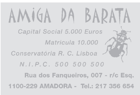
40 x 60 mm