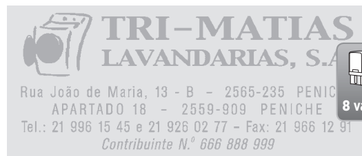
30 x 69 mm