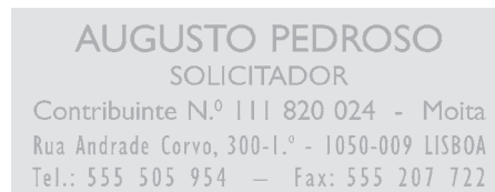
23 x 59 mm