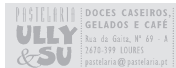
18 x 47 mm