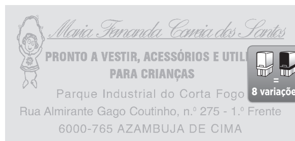
37 x 76 mm